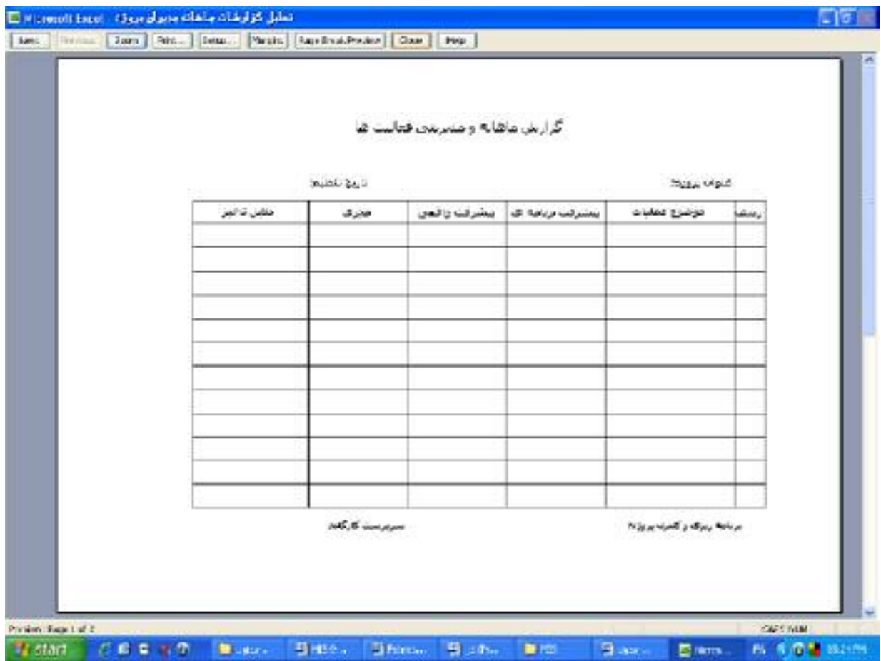
جدول تحلیل گزارش ماهانه و مدیریتی فعالیتها