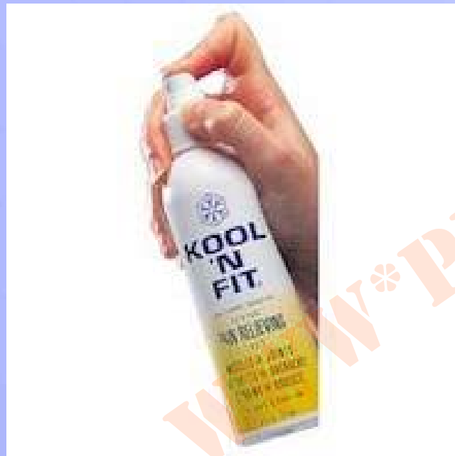
استفاده از مواد دارویی خنک کننده