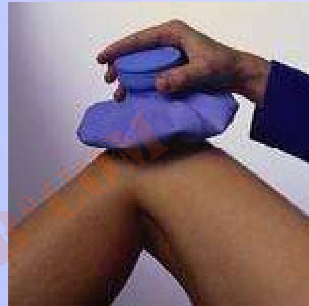
استفاده از کیسه یخ روی منطقه آسیب دیده