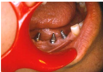
نگاره ی ۱: نمای درون دهانی بیمار پس از بستن پایه ها

زنی ۴۲ ساله، که در سمت راست فک پایین دندان های پشتی را از دست داده بود، برای ساخت پروتز ثابت متکی بر ایمپلنت مراجعه کرد. پس از بررسی و اندازه گیری های معمول، تصمیم گرفته شد که سه عدد ایمپلنت از گونه ی ITI ساخت کشور سوئیس در ناحیه قرار داده شود. الگوی راهنمای جراحی با آکریل شفاف فراهم و در اختیار جراح قرار داده شد. پس از عمل جراحی و فراهم کردن عکس های پرتونگاری آشکار گردید، که به علت نبود استخوان در جاهای مناسب و یا محدودیت های جراحی، ایمپلنت ها با زاویه های بسیار متفاوت با هم قرار داده شده اند. پس از سپری شدن مدت زمان کافی برای اسیواینترگریشن (Osseointegration) و بستن پایه های ایمپلنت بر روی آنها، شدت انحراف ایمپلنت ها از یک مسیر فرضی یکسان برای هر سه، پدیدار گردید (نگاره ی ۱).