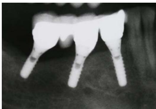
نگاره ی ۴: وضعیت پرتونگاری بیمار هفت سال پس از زمان تحویل پروتز

ایجاد توازی در این سه ایمپلنت با استفاده از تراش بیشتر پایه ها امکان پذیر نبود و در صورت انجام تراش، می بایست کل حجم پایه برای ایجاد توازی تراشیده می شد. از سویی، استفاده از پایه های زاویه دار نیز، قادر به اصلاح مسیرها نبود و در صورت استفاده از آنها، نیاز به تراش آنها برای برقراری مسیر نشست از میان نمی رفت، که در آن صورت، حجم فلز در یک سمت از پیچ پیوند دهنده ی پایه زاویه دار به ایمپلنت بسیار کاهش می یافت و امکان شکستن و یا کاهش گیر و ثبات را در برداشت. از این رو، تصمیم بر آن شد تا با استفاده از روکش های تلسکوپیک پروتز نهایی برای بیمار فراهم گردد.