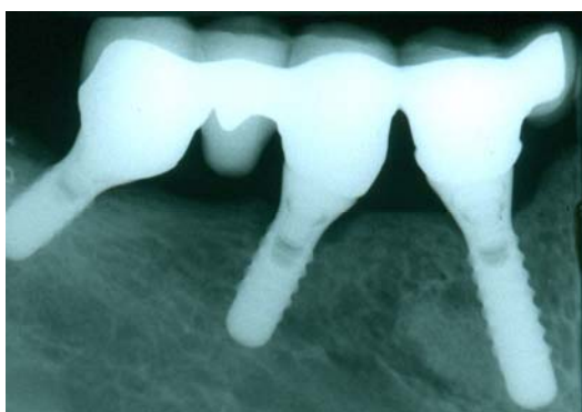
نگاره ی ۳: نمای پرتونگاری کوپینگ ها و بریج نهایی تلسکوپیک، سیمان شده بر روی پایه های ایمپلنت

پس از تنظیمات اکلوزالی و گلیز، در آغاز سه کوپینگ فراهم شده با استفاده از سیمان همیشگی بر روی پایه های ایمپلنت ثابت گردید و سپس، پروتز نهایی، با استفاده از سیمان موقت بر روی آنها متصل گردید تا بتوان برای مهارهای بعدی آن را بیرون آورد. عکس پرتونگاری فراهم و از نشست کامل سه کوپینگ و پروتز روی آن اطمینان به دست آمد (نگاره ی ۳). بیمار در زمان های مقرر بازدید و مهار از نظر اکلوزن و رعایت بهداشت انجام گرفت. نگاره های ۴ و ۵، وضعیت پرتونگاری و بالینی بیمار را پس از هفت سال از زمان تحویل پروتز نشان می دهد.