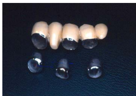
نگاره ی ۵: سه عدد کوپینگ و بریج ساخته شده بر روی آنها

قالب گیری با روش معمول ایمپلنت های ITI انجام گردید و الگوی لابراتواری فراهم شد. سه کوپینگ بر روی دای موم گذاری گردید و دیواره های این کوپینگ های مومی با استفاده از سرویر، برای تامین مسیر نشست واحد شکل داده شد. پس از انجام کستینگ، کوپینگ های فلزی فراهم شده به دهان بیمار انتقال داده شد و قالب پیک آپ (pick up) از بیمار فراهم گردید. کوپینگ های فلزی پیک آپ شده برای مهار نهایی بر روی سرویر مجهز به هندپیس انتقال داده شد و اصلاحات لازم برای تامین مسیر نشست برای پروتز نهایی به وسیله ی فرز و هندپیس انجام گردید. سپس، موم گذاری برای تهیه ی ساختار فلزی پروتز نهایی انجام و پس از کستینگ پرسن گذاری انجام شد (نگاره ی ۲).