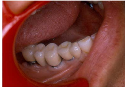
نگاره‌ی ۵: وضعیت بالینی بیمار هفت سال پس از زمان تحویل پروتز

قطر کوپینگ از قطر پایه‌ی اولیه بیشتر است. بنابراین، گیر بیشتر خواهد بود و افزون بر آن فنی ورز می‌تواند کوپینگ را با زاویه‌ی تقارب دلخواه برای تامین‌گیر و ثبات شکل دهد. دندانپزشک هر یک از کوپینگ‌ها را در مسیر نشست خود و جدا از دیگران با سیمان رزینی می‌چسباند و پروتز ثابت نهایی بر روی آنها قرار داده می‌شود (نگاره‌ی ۶).