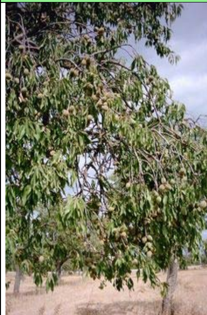
درخت بادام همراه میوه، اسپانیا.