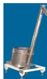
دستگاه بالابریودر Model: M-1035