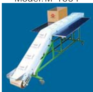
دستگاه تسمه نقاله Model: M-1041