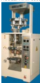
دستگاه بسته بندی گرانول FM-1008 : Model