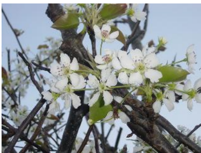
شکوفه های گلابی

است. اکنون هزاران گونه گلابی پرورش یافته (اهلی)، وجود دارد. در مناطق استوایی بکلمه گلابی را می توان برای نامیدن آووکادو ( Persea Americana ) که هیچ ارتباطی هم با گلابی های واقعی ندارد بکار برد. گلابی دارای گونه های متعددی می باشد که مهمترین آنها از نظر تولید میوه ( Pyrus communis گلابی اروپایی یا ساده) و ( pyrus pyrifolia گلابی آسیایی یا گلابی-