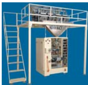
دستگاه بسته بندی گرانول Model : MPW-1006