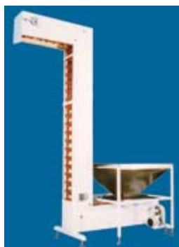
دستگاه بالابر پپاله ای Model: M-1031 Model: M-1032 Model: M-1034