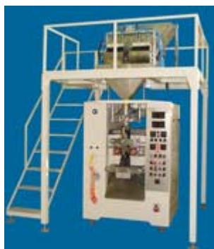
دستگاه بسته بندی گرانول وزنی نوزین الکترونیکی (۲ نوزین) MODEL: MPW-1005