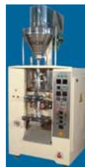
دستگاه بسته بندی پودر Model : FM-1012