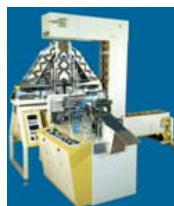
نوزین دار الکترونیکی MODEL: MPW-1111