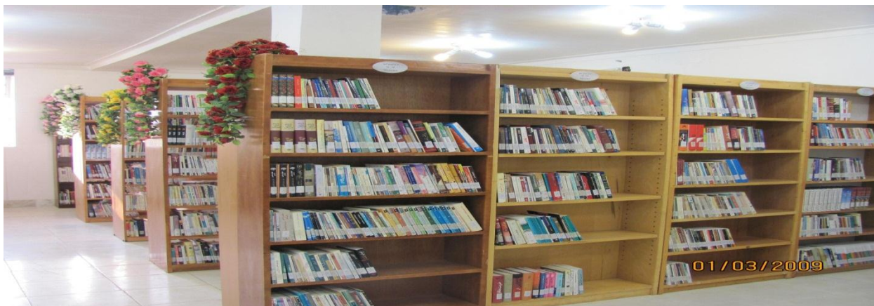
تصویر ۲-۱: نمایی از مخزن های موجود

همچنین شامل ۱۰ رده کتاب در عناوین کلیات، فلسفه و روانشناسی، دین، علوم اجتماعی و تاریخ، زبان، علوم خالص، علوم عملی، هنر، ادبیات و کودکان هست و دارای ۱۰ هزار جلد کتاب که حدود ۱۵۰۰ جلد آن مربوط به بخش کودک و حدود ۵۰۰ عنوان نشریه هست.