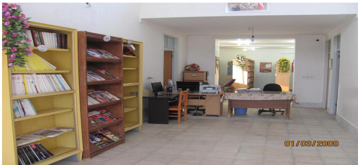
تصویر ۱-۱: نمای داخلی سالن کتابخانه

از آنجا که نهاد کتابخانه به عنوان نهادی فرهنگی هست علاوه بر خدمات کتابداری به برگزاری کلاس های فوق برنامه نیز می پردازد. از این رو در سال ۱۳۹۱ این نهاد به عنوان کتابخانه نمونه استان معرفی گردیده است.