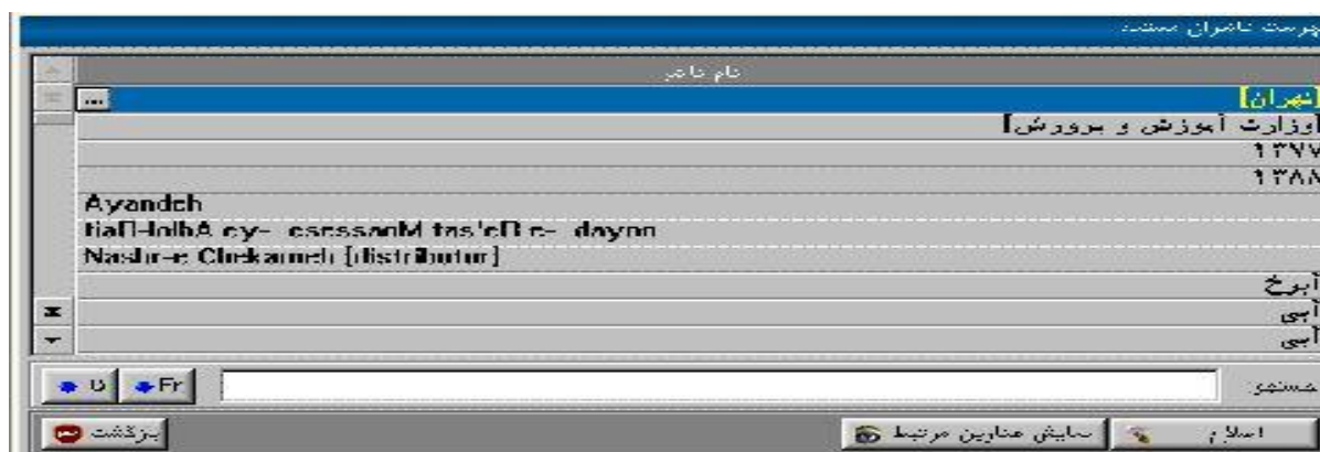
شکل ۸-۲: فهرست ناشران مستند و جستجو بر اساس مشخصات ناشر