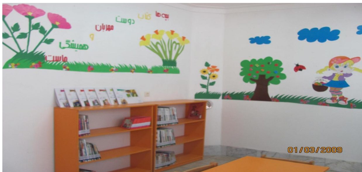
تصویر ۳-۱: نمای داخلی بخش کودک

همچنین شامل ۱۰ رده کتاب در عناوین کلیات، فلسفه و روانشناسی، دین، علوم اجتماعی و تاریخ، زبان، علوم خالص، علوم عملی، هنر، ادبیات و کودکان هست و دارای ۱۰ هزار جلد کتاب که حدود ۱۵۰۰ جلد آن مربوط به بخش کودک و حدود ۵۰۰ عنوان نشریه هست.