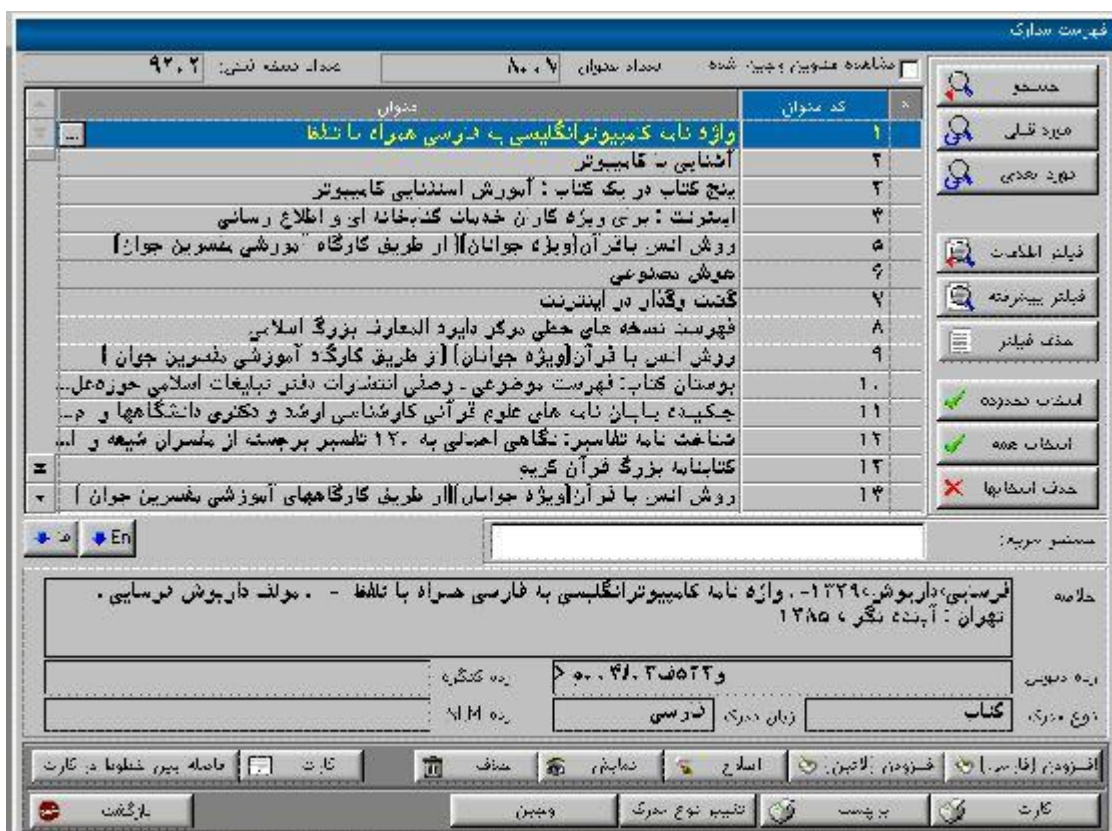
شکل ۳-۲: فهرست مدارک موجود جهت افزودن کتاب جدید

در بخش مدارک/ورود کتاب/افزودن (با این کار کادر مشخصات مدرک باز می شود) که هرصفحه شامل موارد زیر میباشد.