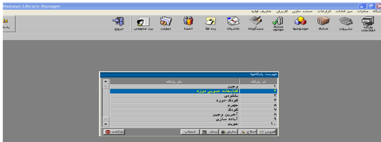
شکل ۲-۲: افزودن پایگاه جدید

برای این کار در قسمت پایگاه اطلاعات/پایگاه مورد نظر را انتخاب می کنیم و بر روی دکمه افزودن کلیک می کنیم. در کادر باز شده بخش های اصلاح، نمایش و حذف و... وجود دارد.