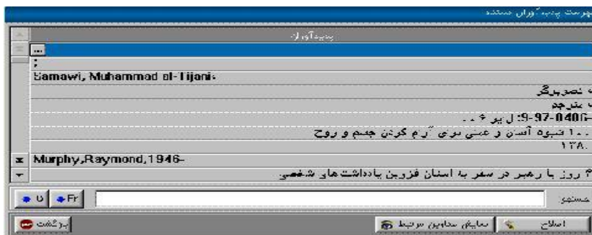
شکل ۷-۲: فهرست پدید آوران مستند و جستجو بر اساس نام خانوادگی نویسنده یا مترجم

روی منو پدید آورنده کلیک کرده پنجره ی بالا باز می شود، سپس در قسمت جستجو فقط نام خانوادگی نویسنده یا مترجم را تایپ می کنیم، نام های مختلفی همراه تاریخ تولد و فوت نویسندگان ظاهر می شوند، سپس روی نویسنده مورد نظر خود کلیک کرده و در انتها روی نمایش کلیک کرده مشاهده خواهیم کرد که عناوین مرتبط با کتاب های مورد نظر بر روی پنجره ای دیگر با کد عنوان و نام عنوان ظاهر می شود، در انتها کتاب مورد نظر خود را انتخاب کرده و در اختیار کتابدار می گذاریم.