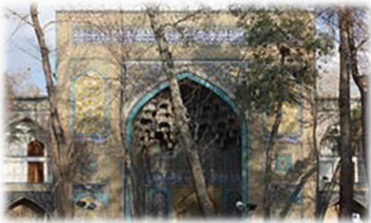
مدرسه چهارباغ در اصفهان