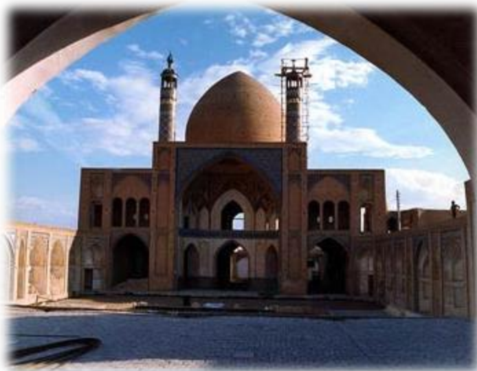
مسجد و مدرسه آقا بزرگ کاشان