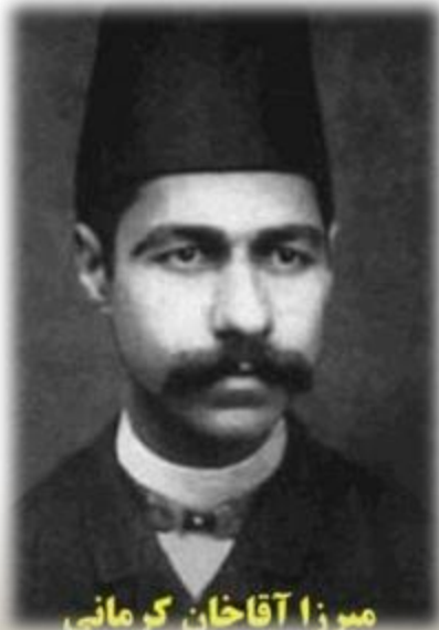
میرزا آقاخان کرمانی