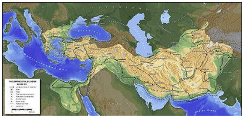
مسیر حمله اسکندر به ایران